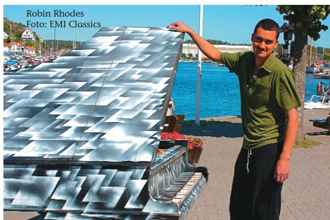
Robin Rhodes

Mit „Pictures Reframed“ hat er gemeinsam mit dem im südafrikanischen Kapstadt geborenen Street-Art- und Aktions-Künstler Robin Rhode ein multimediales Projekt geschaffen, das Modest Mussorgskys Klavierzyklus „Bilder einer Ausstellung“ in ein neues und spannendes Bilderfest verwandelt.