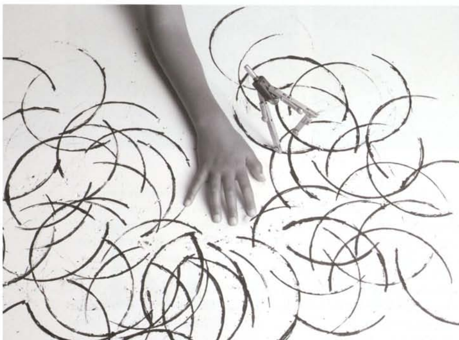
Det visuelle akkompagnement til "Kyllingenes ballett i eggeskallet"