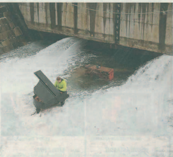
'Cadet Frame (Promenade nr. 1)' (onder).

ik een aantal van mijn eigen ideeën inbrengen. Ik had filmmateriaal van een zwarte plastic zak die vasthing aan prikkeldraad bij een station. Dat werd plots de link tussen 1860 en nu. De ossenkar en de trein zijn het gemeenschappelijke symbool."