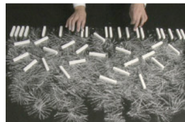
Le Marché de Limoges © Robin Rhode

trois films qui le détournent de sa vocation musicale : dans « Gnome », ses fils emmêlés tombent du plafond et entament un ballet abstrait sur la scène d'un théâtre blanc en imitant la démarche claudiquante du gnome aux jambes tordues imaginé au départ d'un croquis de casse-noisette ; dans le « Marché de Limoges », unique rupture inexplicable avec l'œuvre d'Hartmann, il devient un instrument de dessin grâce à ses touches de craie ; enfin, sacrilège entre tous, dans la célèbre « Grande Porte de Kiev », un projet architectural imaginé par Hartmann pour le Tsar Alexandre II, mais jamais exécuté, et perçu par Rhode comme une critique des abus de pouvoir de l'impérialisme russe, le piano est complètement noyé, l'écoulement implacable de l'eau métaphorisant la purge de l'histoire.