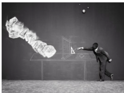
Promenade n°4 © Robin Rhode

L'imagerie de Rhode suit la logique de l'œuvre de Moussorgski, chaque tableau correspondant à une animation. Elle se présente tantôt comme une réflexion générale sur la destruction par l'invasion tantôt comme un jeu sur les formes et le mouvement, particulièrement la forme du losange qui renvoie au diamant et à ses propriétés physiques uniques. Les « Promenades » 1, 2, 3 et 5, épisodes transitoires qui décrivent la progression du compositeur à travers l'exposition et qui agissent comme un élément unificateur, sont basées sur la jeunesse de Moussorgski et son activité au sein de l'armée en tant que cadet. Le personnage de l'animation est un jeune homme sur le chemin de sa propre découverte dont les pieds reposent sur des cubes qui s'inscrivent à travers l'espace. Il ne touche jamais le sol, rejetant la réalité. Les troisième et cinquième promenades font référence aux problèmes d'alcoolisme de Moussorgski : le personnage trébuche dans son environnement géométrique, comme s'il était en état d'ébriété. La quatrième promenade diffère, puisqu'elle met en scène une table d'architecte du XVI e siècle sur laquelle notre personnage dessine un losange qui surgit en face de lui en trois dimensions, l'objet fonctionnant comme une extension de l'imagination de l'artiste.