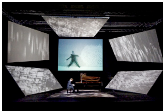
Avant-première de Pictures Reframed au festival de Risor

Lors de ces concerts, la présentation de Pictures Reframed sera accompagnée de l'exécution des Kinderszenen de Schumann ainsi que de la création d'une pièce inspirée par l'œuvre de Rhode due à l'Autrichien Thomas Larcher (° 1963), compositeur avec lequel Rhode et Andsnes ont eu l'occasion de collaborer dans le passé et dont le choix s'est imposé comme une évidence pour compléter le programme. Durant ce même mois, la Perry Rubenstein Gallery de New York proposera une grande exposition entièrement consacrée à une nouvelle œuvre de Robin Rhode. Enfin, EMI Classics immortalisera Pictures Reframed dans une édition de luxe collector annoncée pour l'automne, comprenant un CD et un DVD accompagnés d'un livre illustré dans le style d'un catalogue d'exposition. Pour de plus amples informations, visiter le site http://picturesreframed.com